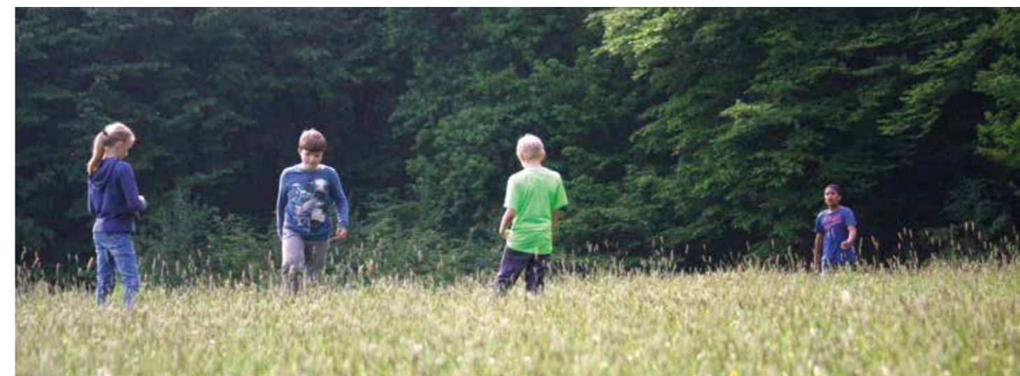
Rennen und Toben: Die Kinder wollen sich nach langem Stillsitzen in der Schule bewegen. Die Wildnisgruppe ermöglicht ihnen das.

Heute dürfen sich die Kinder mit verbundenen Augen einen Baum aussuchen, ihn ertasten, die Umgebung darum herum erforschen. Ob sie danach ohne Augenbinde diesen Baum wiederfinden? „Klar, das ist ja ganz einfach“,