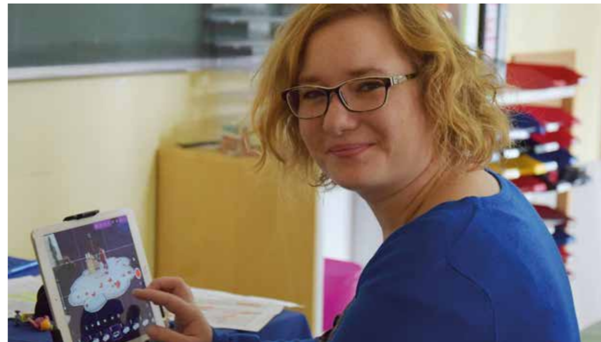
Die Studierenden der Fachakademie lernen den Umgang mit digitalen Medien, um auf die Arbeit im Kindergarten und in der Jugendhilfe vorbereitet zu sein.

Die 41-Jährige unterrichtet seit 20 Jahren Medienpädagogik. „Für die Schülerinnen und Schüler ist es wichtig, ihre eigenen Schwellenängste abzubauen und ein Verständnis dafür zu entwickeln, warum viele Kinder und Jugendliche von digitalen Medien so fasziniert sind.“